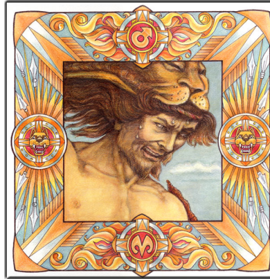
Archetypus: Der Zerstörer