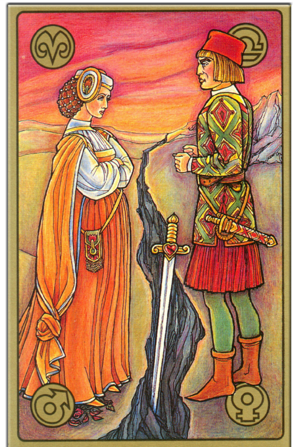
symbolon-Karte: Der Streit (Der Kampf der Geschlechter)