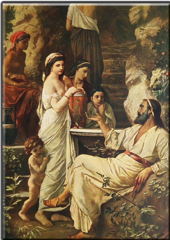
"Er ist wirklich ein großer Mann! Von ihm kann ich lernen, wie man eine guter Mensch wird. So ganz selbstverständlich! Ohne Allüren!"