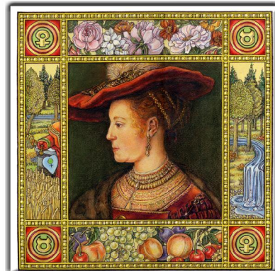
Archetypus: Die Kore