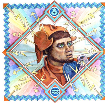
Archetypus: Der Trickster