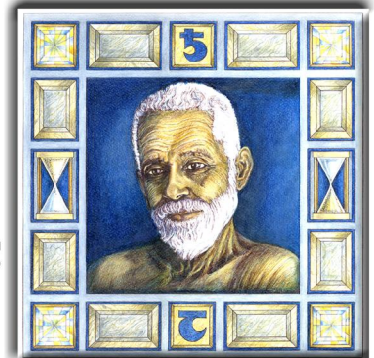
Archetypus: Das Schicksal