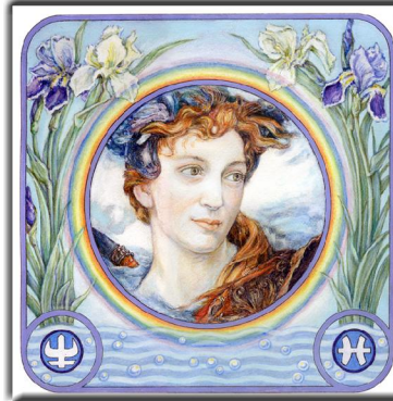
Archetypus: Der Heilsbringer

Liebe Freunde von symbolon, wir haben jetzt mehr als zwei Jahre lang jeden Dienstag eines dieser Blätter ins Netz gestellt. Das hier vorliegende Blatt trägt die Nummer 142. Es wird noch zwei weitere Petit Fours geben, dann ist das Ende da. Der ganze August steht euch noch zur Verfügung, die vorherigen Blätter unentgeltlich aus dem Netz zu ziehen. Dann werden sie abgeschaltet. Also hurtig! Im Oktober gibt es eine vollständig neue Spielweise. Lasst Euch überraschen?