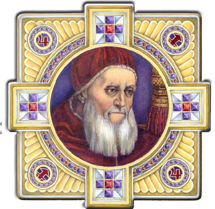
Archetypus: Der Sinn