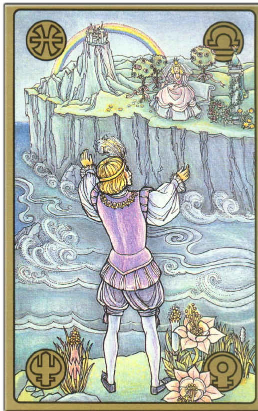
symbolon-Karte: Die Königskinder

Mein Gott, von Nahem sehe ich das ja erst: Der ist ja viel zu jung für mich. Wie konnte ich denn so dahin träumen. Schon wieder nichts. Schon wieder habe ich mir etwas vorgemacht.