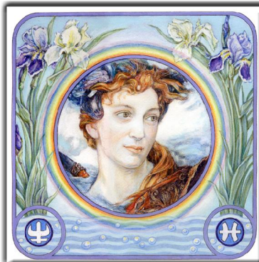
Archetypus: Der Heilsbringer