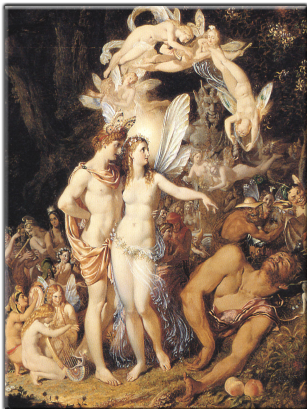
Das ist die richtige Welt! Warum kann ich nicht hier leben?