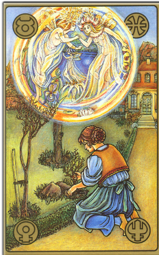
symbolon-Karte: Der Garten der Geister