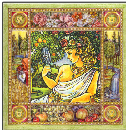
Archetypus: Die Kore