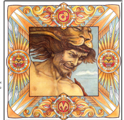
Archetypus: Der Zerstörer