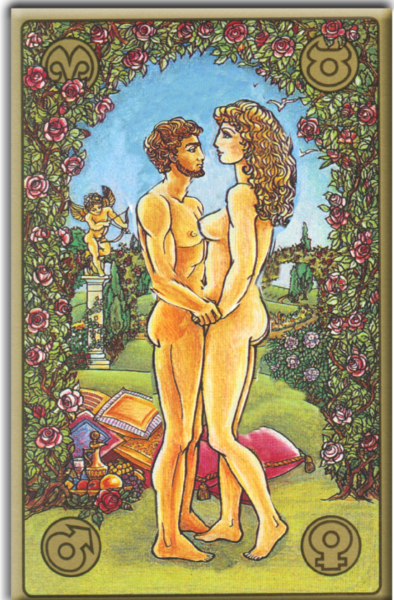
symbolon-Karte: Die Geliebte