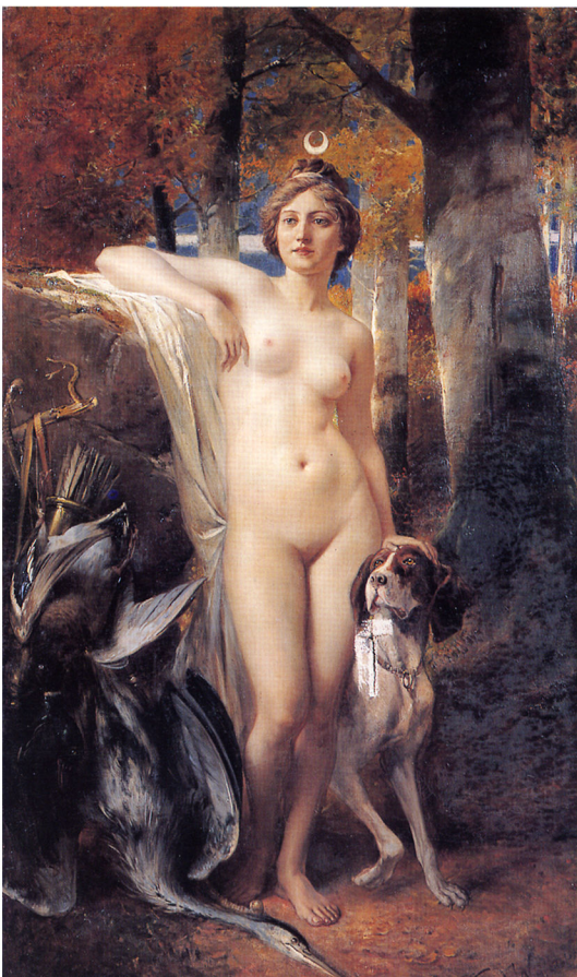
Die Jagdgöttin Diana