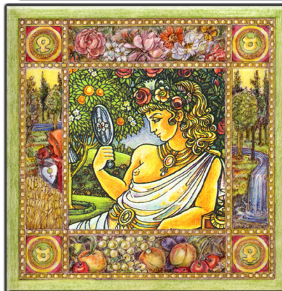
Archetypus: Die Kore