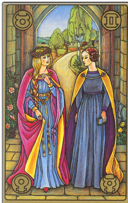
symbolon-Karte: Die Goldmarie