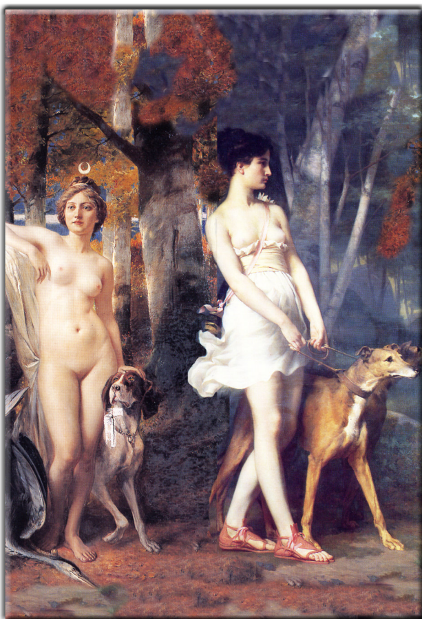
Wer wird gewinnen: Rechts oder Links?