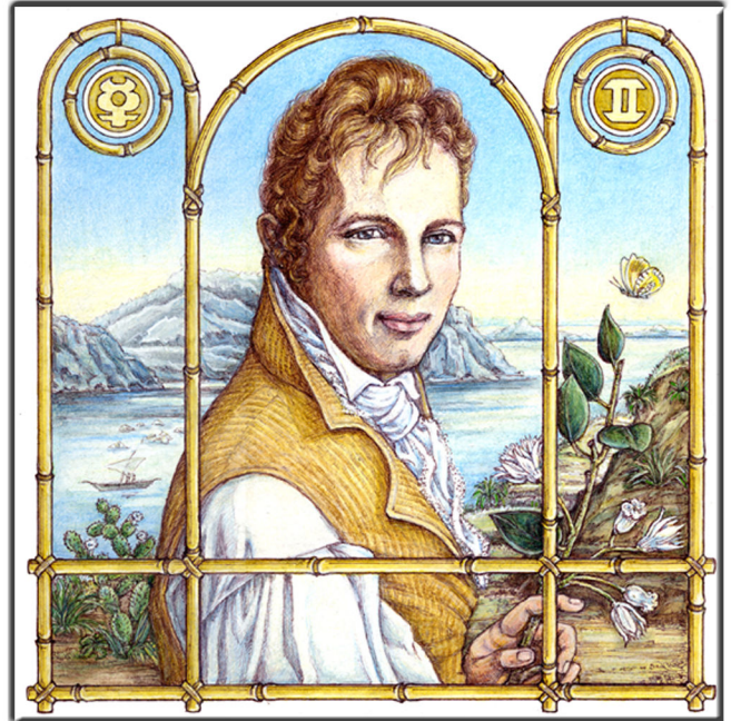
Archetypus: Der Rover