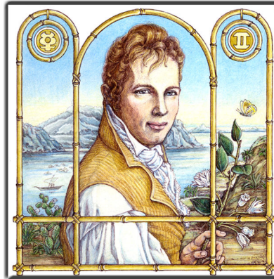
Archetypus: Der Rover