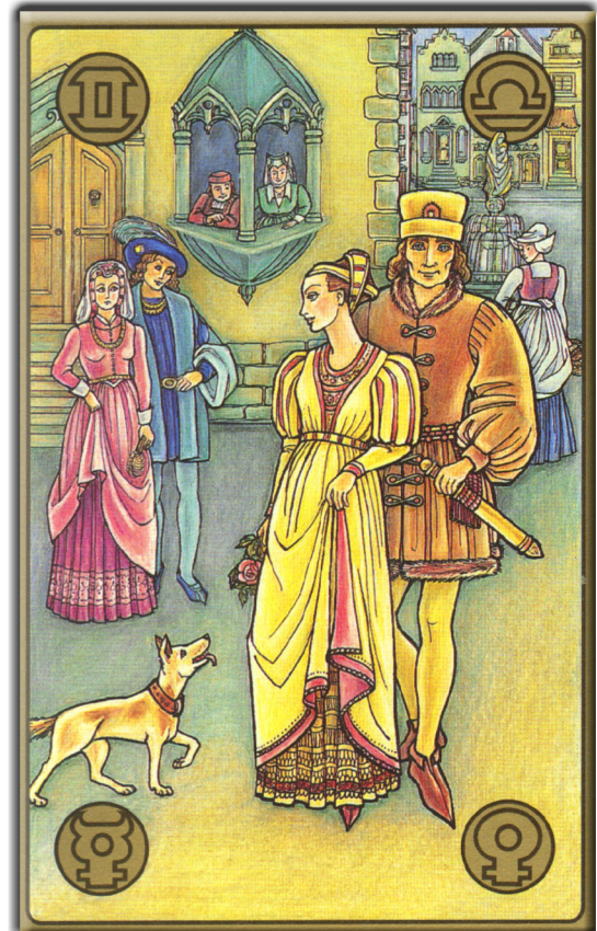
symbolon-Karte: Marktplatz der Eitelkeiten