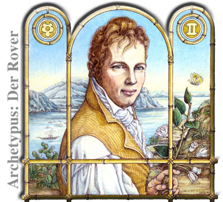
Archetypus: Der Rover