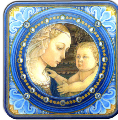
Archetypus: Die Anima