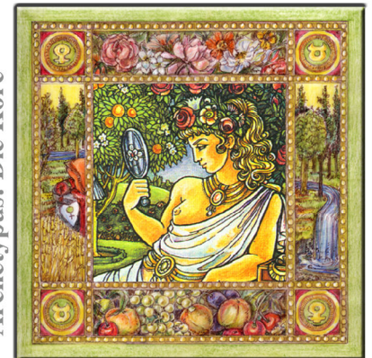
Archetypus: Die Kore