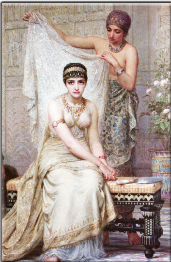
Ich habe alles! Aber warum tut mir immer etwas anderes weh?