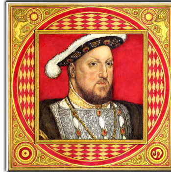
Archetypus: Der Animus