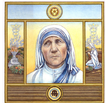
Archetypus: Der Regulator