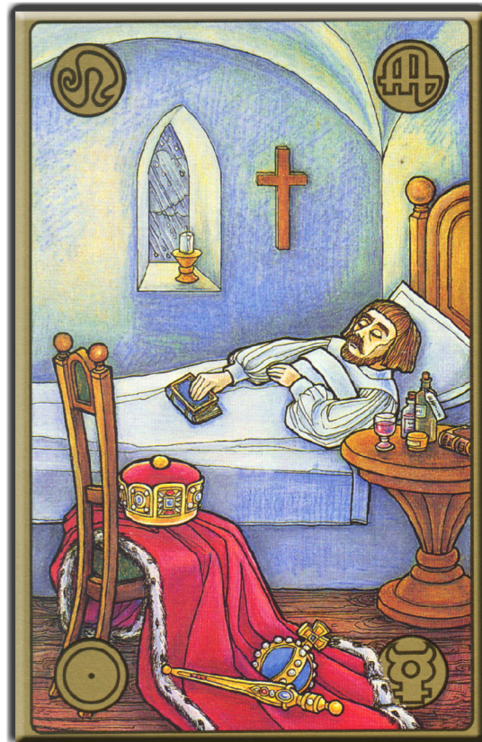
symbolon-Karte: Der kranke König

Ich wusste gar nicht, wie schwer das ist, seine Insignien beiseite zu legen, und sich helfen zu lassen!: