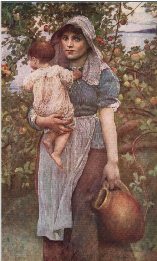
Ja, der Segen kommt von oben! Aber die Erinnerung, die dich heilen kann, kommt von innen!