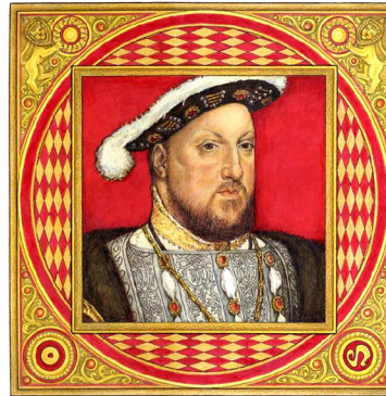
Archetypus: Der Animus