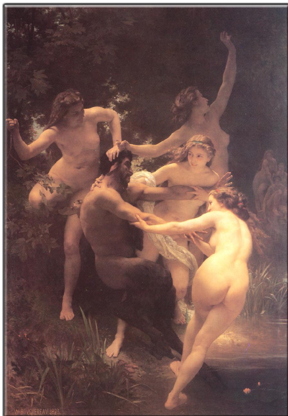
Was soll den das! Lasst mich in Ruhe! Nein...! Ich will da nicht hin!! Auf keinen Fall!