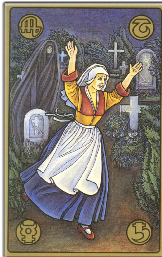
symbolon-Karte: Die Angst