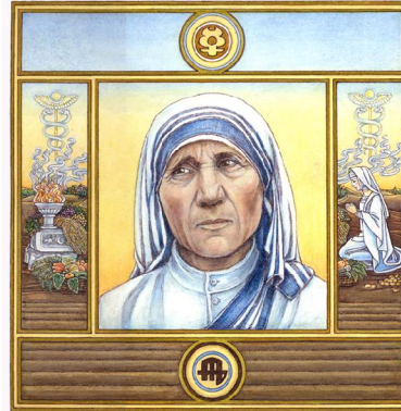
Archetypus: Der Regulator