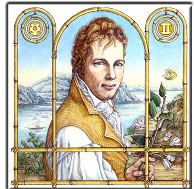
Archetypus: Der Rover