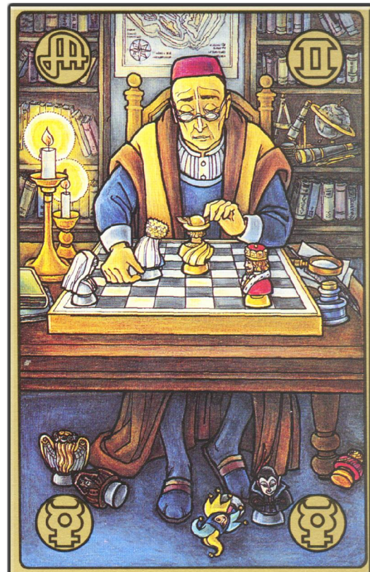
symbolon-Karte: Der Strategie