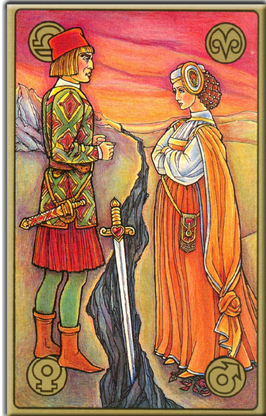
symbolon-Karte: Der Streit