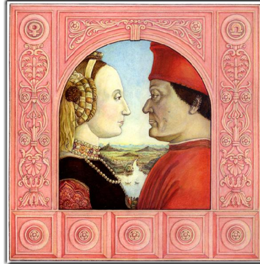
Archetypus: Der Schatten