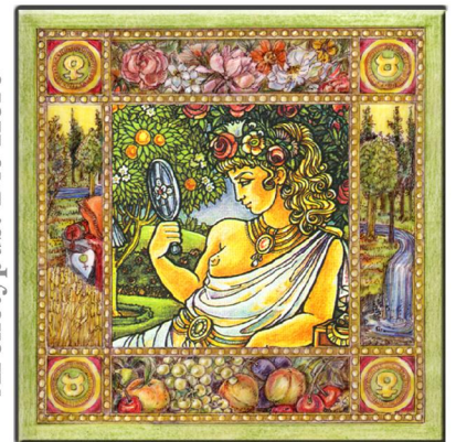
Archetypus: Die Kore