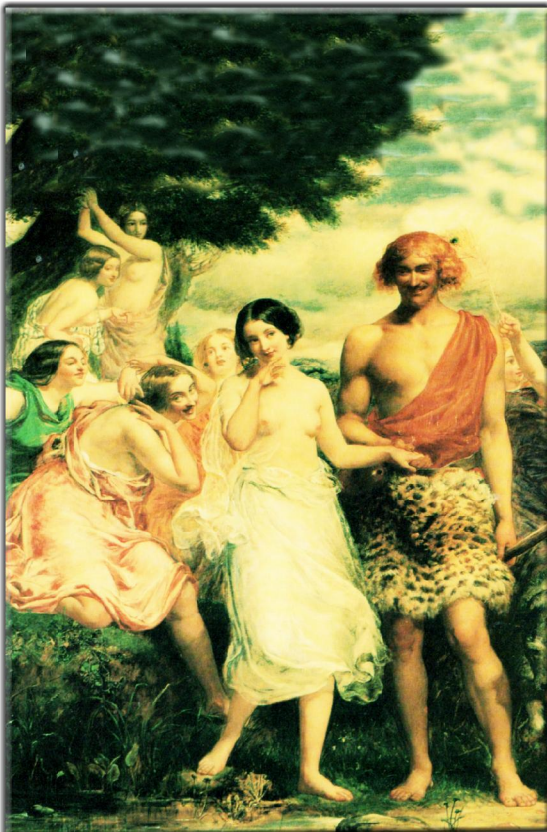
Ja, gackert nur, ihr Hühner, damit habt ihr nicht gerechnet! Das habt ihr mir nicht zugetraut, gell?