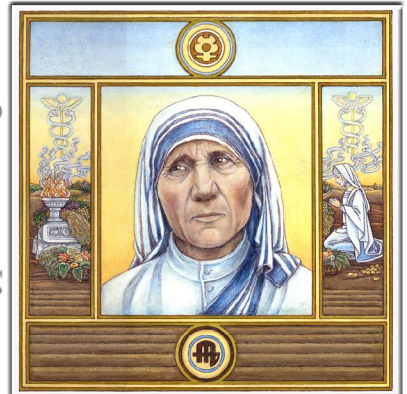
Archetypus: Der Regulator