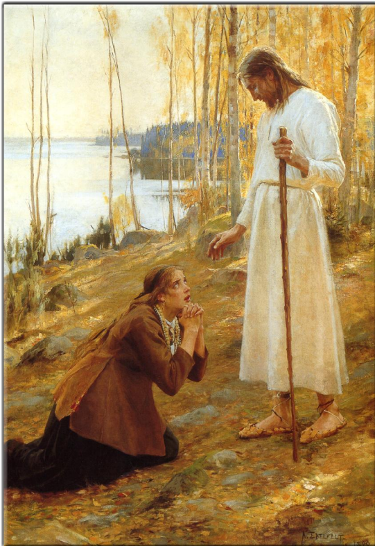
„...und vergieb uns unsere Schuld, wie wir vergeben unseren Schuldigern ...“