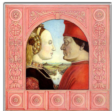
Archetypus: Der Schatten