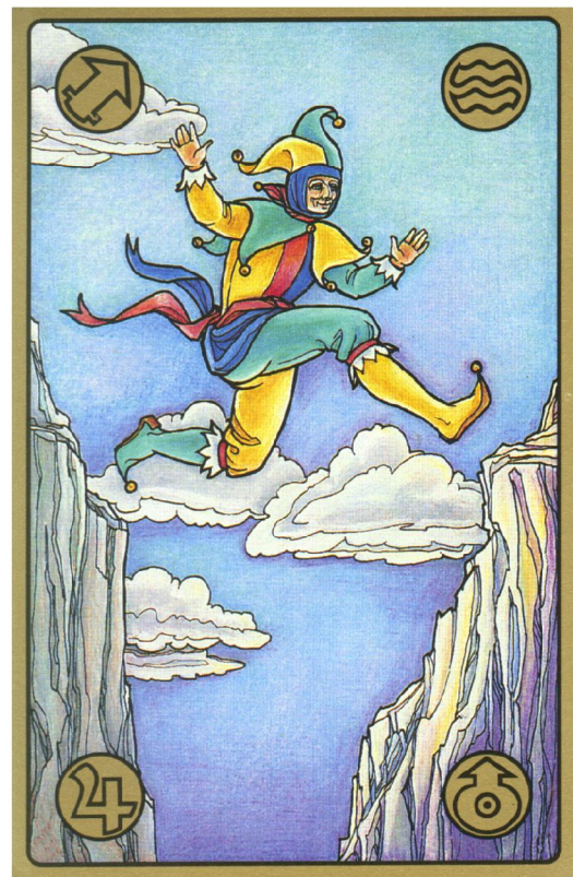
symbolon-Karte: Der Quanten-Sprung

Nein, das mit den Windmühlen-Flügeln war ziemlich peinlich. Das sehe ich ein. Aber Jungfrauen vor dem Drachen zu schützen, das ist ja nach wie vor eine edle Sache?