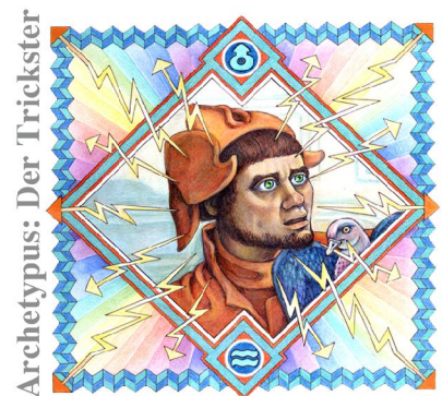
Archetypus: Der Trickster