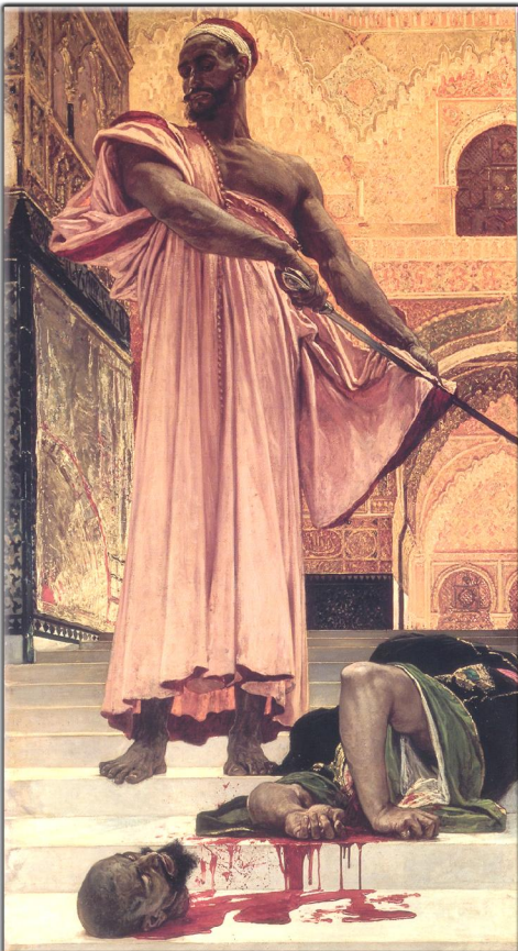
Schon wieder die Welt von einem Ungläubigen gereinigt! Der Vater hoch oben wird es mir danken.