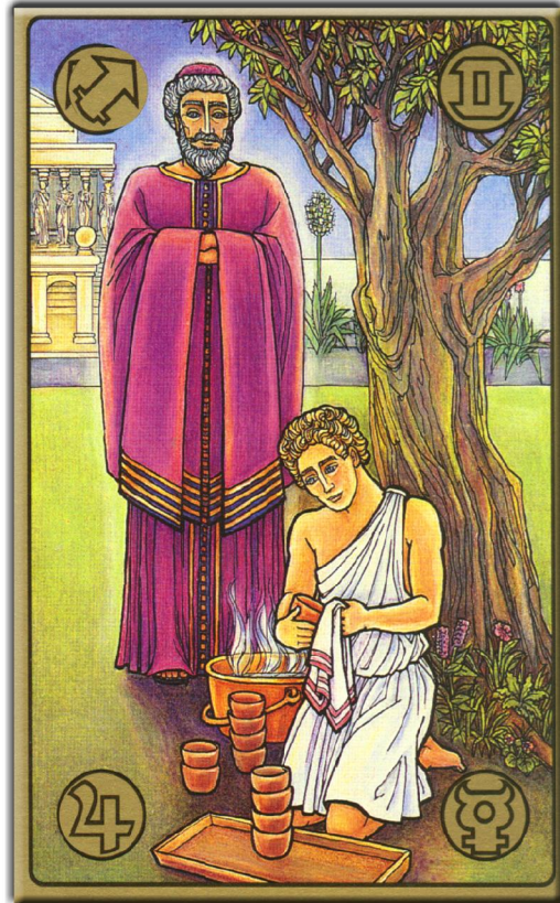
symbolon-Karte: Meister und Schüler

"Ich glaube, ich werde es nie lernen. So viel Kraft kann ich nicht aufbringen.. Ich bin doch nur ein Mädchen." "Sie schafft es, ich sehe es deutlich!"