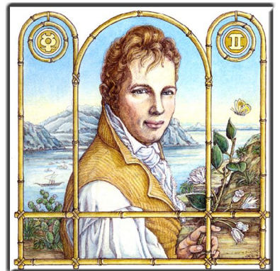
Archetypus: Der Rover