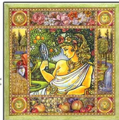
Archetypus: Die Kore