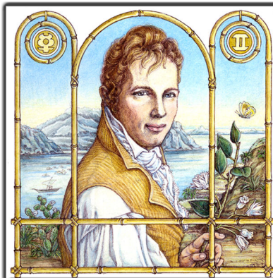
Archetypus: Der Rover