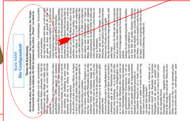
2. Seite Din A4 in Farbe