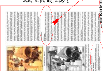
3. Seite Din A4 in Farbe

Das Problem Du hast dem überlebigen Leben den Kampf angehen lassen. Natürlich kannst du das für dich so halten und dich deine unadäquate Lebensführung aufstellen, die dir verfallen und aus-sagen-lässt.