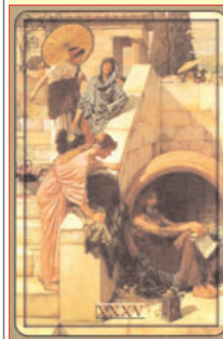
1. Seite Din A4 in Farbe

Aus all diesen Gründen ist es wichtig, dass der Beratende das Spiel auf seinem Computer hat. Dort wird der Text der Karte, die auf dem Tisch gezogen worden ist, aufgerufen und beides (Karte und Text) können ausgedruckt und dem Klienten mit nach Hause gegeben werden. Natürlich ist dafür ein normaler Computer (mit Farbdrucker!) nötig, wie er heute in jeder astrologischen Praxis obligatorisch ist. Folgende Ausdrücke gibt es dabei: