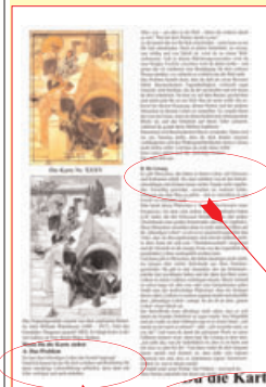
3. Seite Din A4 in Farbe