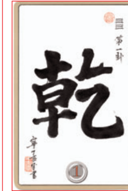
Spielkarte, die der Orakel-suchende ziehen kann, nach diesem Bild des Schriftzeichens gestaltet.