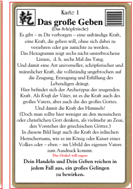
Neue Spielkarte, die die Aussage des Orakels relativ konkret beschreibt.