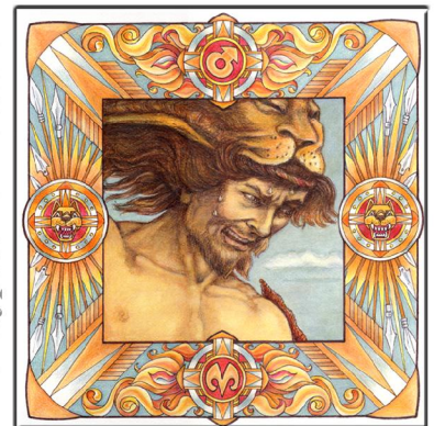
Archetypus: Der Zerstörer