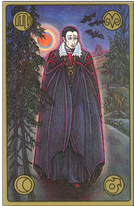
symbolon-Karte: Der Vampir

Wieso heißt er eigentlich der "Untote"? Weil er nicht selbst lebt. Zum Leben braucht er jemanden, der ihm seine (Lebens-) Kraft zur Verfügung stellt. (Bei einem realen Vampir war es ja der Lebenssaft, das Blut.)