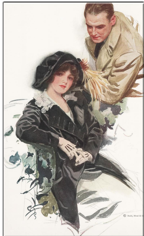
Harrison Fisher: Beauties, New York, 1913 Name des Gemäldes: On the Summer Hotel Veranda