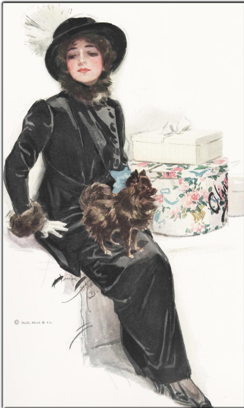
Harrison Fisher: Beauties, New York, 1913 Name des Gemäldes: My Lady of Yule