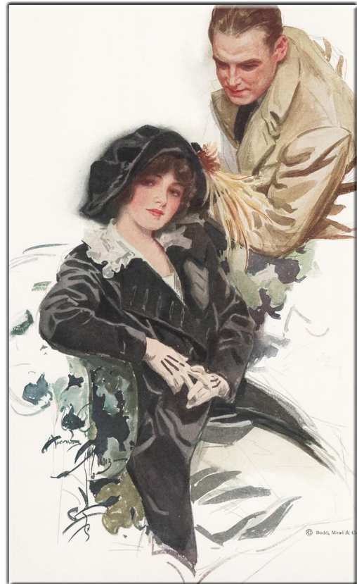
Harrison Fisher: Beauties, New York, 1913 Name des Gemäldes: On the Summer Hotel Veranda