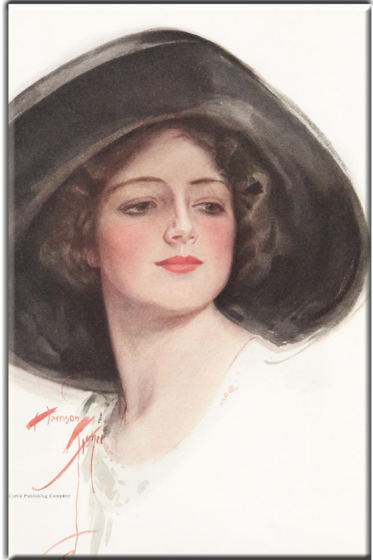
Harrison Fisher: Beauties, New York, 1913 Name des Gemäldes: A Song of Tessie

Liebe Freunde von Symbolon, eine neue, die zehnte, Staffel von "Petites Images" (kleine Bilder) ist mit den Blättern 10-01 bis.10.20, im Aufmarsch. Zunächst einmal mit einer Fortsetzung der Tierkreis-Postkarten aus den vorherigen P. I. (9. 17 bis 9.20), bis alle drei Postkarten-Serien abgebildet sind. Sodann (heute beginnend) mit wunderbaren Illustrationen von Harrison Fisher, jetzt und an den nächsten beiden Folgen von P. I. Auch hier geht mein Dank wieder (doppelblitz) an Ferdinand Heindl!