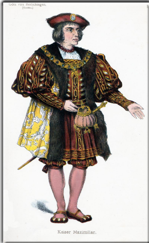
„Trachtenbilder für die Bühne“: (Berlin 1892) Bild aus: Goethe: Götz von Berlichingen: Rolle: „Kaiser Maximilian“, Künstler: Bruno Köhler