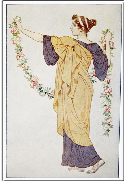
"Dekorative Vorbilder", Stuttgart, (1907) Bd. 18 Blatt 57 b, Professor G. Sturm: "Weibliche Figuren mit Blumenbinden"

Liebe Freunde von Symbolon, die ersten beiden Staffeln unserer Serie "Petites Images" (kleine Bilder) ist mit den Blättern 1.1 bis 1.20 und 2.1 bis 2.20 beendet. Und so beginnt ein neuer Zyklus. Mit den Nummern 3.1 bis 3.20 wird es wieder jeden Dienstag jeweils 2 mal 4 Bilder geben. Mit neuen Illustratoren, die jedoch ebenfalls jeweils 70 Jahre tot sein müssen. Und die endlich wieder aus dem Dunkel des Vergessens hinauf gehoben werden dürfen. Wieder wird Ferdinand Heindl aus Wien die Betreuung für diese Bilder übernehmen, und sie für das Netz herrichten. Dafür gilt ihm – wie immer – unser Dank!