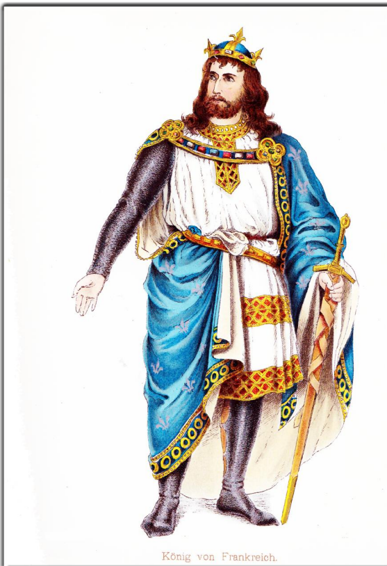
König von Frankreich.