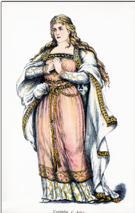
Cordelia. (I. Act.)