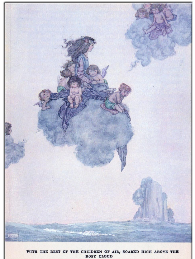
WITH THE REST OF THE CHILDREN OF AIR, SOARED HIGH ABOVE THE ROSY CLOUD