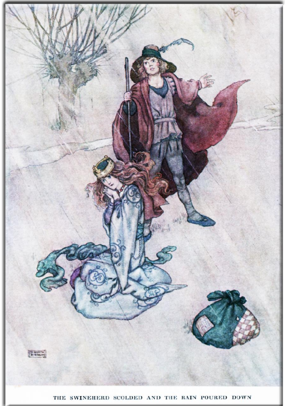
THE SWINEHERD SCOLDED AND THE RAIN POURED DOWN