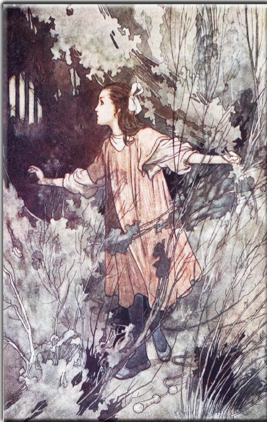
Seite 1: “The Secret Garden”: Illustrator: Charles Robinson, Autorin: Frances Hodgson Burnett, Verlag: William Heinemann, (London 1912)