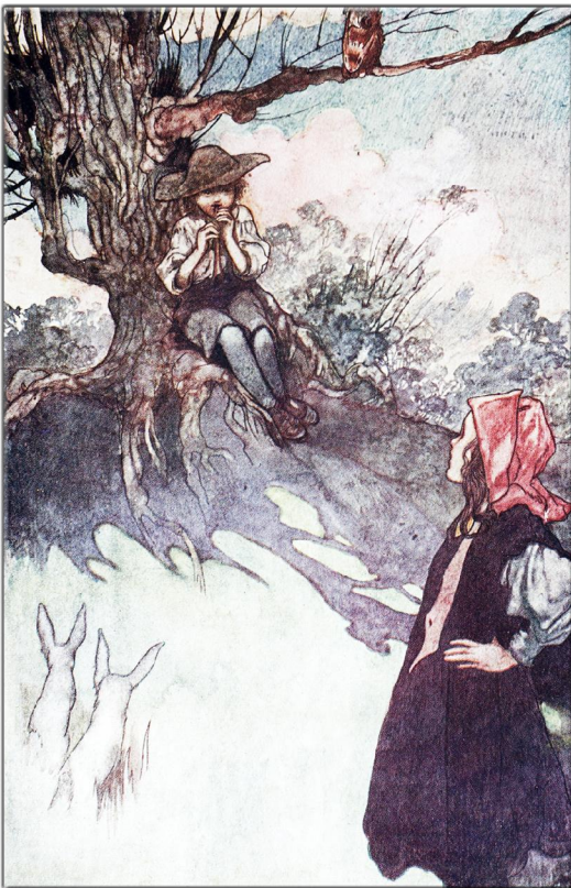
Seite 97: “The Secret Garden”: Illustrator: Charles Robinson, Autorin: Frances Hodgson Burnett, Verlag: William Heinemann, (London 1912)