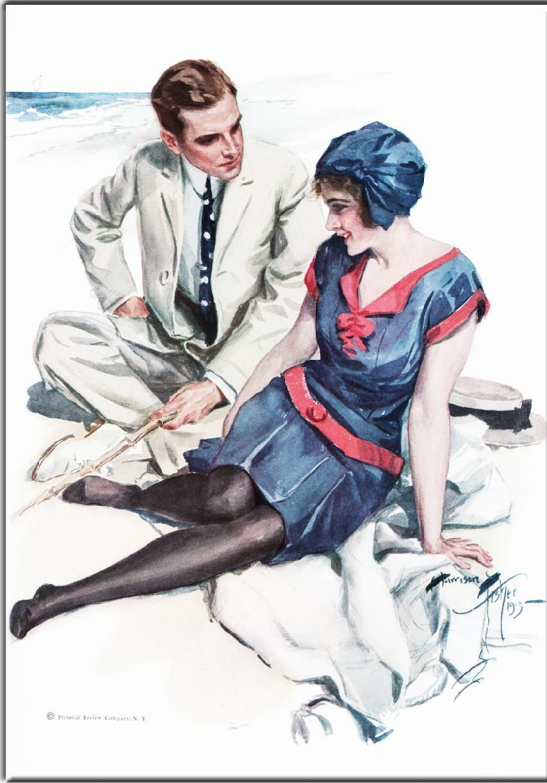
“BEAUTIES”, New York, (1913 ) Bild.9 Illustrator: Harrison Fischer, Verlag: Dodd, Mend & Company

Liebe Freunde von Symbolon, die ersten drei Staffeln unserer Serie "Petites Images" (kleine Bilder) ist mit den Blättern 1.1 bis 1.20, 2.1 bis 2.20 und 3.1 bis 3.20 beendet. Und so beginnt ein neuer Zyklus. Mit den Nummern 4.1 bis 4.20 wird es wieder jeden Dienstag je 2 mal 4 Bilder geben. Mit neuen Illustratoren, die jeweils ziemlich unbekannt sind. Die endlich wieder – das ist unser Anspruch – aus dem Dunkel des Vergessens hinauf gehoben werden sollen. Ein Künstler freilich war schon mit 4 Bildern im 3. Zyklus anwesend. Er ist so gut, dass wir ihn auch in der 4. Staffel weiter lebendig lassen wollen. Wieder wird Ferdinand Hendl aus Wien die Bilder für das Netz bearbeiten. Dafür gilt ihm – wie immer – unser Dank! Bis heute sind 60 Blätter mit 240 Illustrationen in unserem kleinen (petit) Bauchladen erschienen. Jetzt also auf zu den nächsten 80 Bildern!