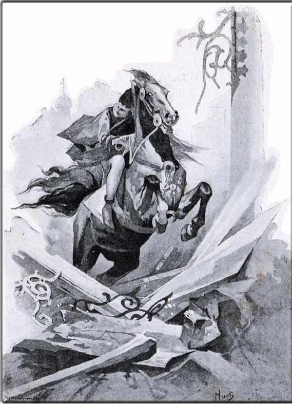
Ein sehr unbekannter "Alfons MUCHA": Illustrationen des Buches: Xavier Marmier, Contes D'Meres, Paris 1892, Seite 13

Liebe Freunde von Symbolon, die ersten drei Staffeln unserer Serie "Petites Images" (kleine Bilder) ist mit den Blättern 1.1 bis 1.20, 2.1 bis 2.20 und 3.1 bis 3.20 beendet. Und so beginnt ein neuer Zyklus. Mit den Nummern 4.1 bis 4.20 wird es wieder jeden Dienstag je 2 mal 4 Bilder geben. Mit neuen Illustratoren, die jeweils ziemlich unbekannt sind. Die endlich wieder – das ist unser Anspruch – aus dem Dunkel des Vergessens hinauf gehoben werden sollen. Ein Künstler freilich war schon mit 4 Bildern im 3. Zyklus anwesend. Er ist so gut, dass wir ihn auch in der 4. Staffel weiter lebendig lassen wollen. Wieder wird Ferdinand Heindl aus Wien die Bilder für das Netz bearbeiten. Dafür gilt ihm – wie immer – unser Dank! Bis heute sind 60 Blätter mit 240 Illustrationen in unserem kleinen (petit) Bauchladen erschienen. Jetzt also auf zu den nächsten 80 Bildern!