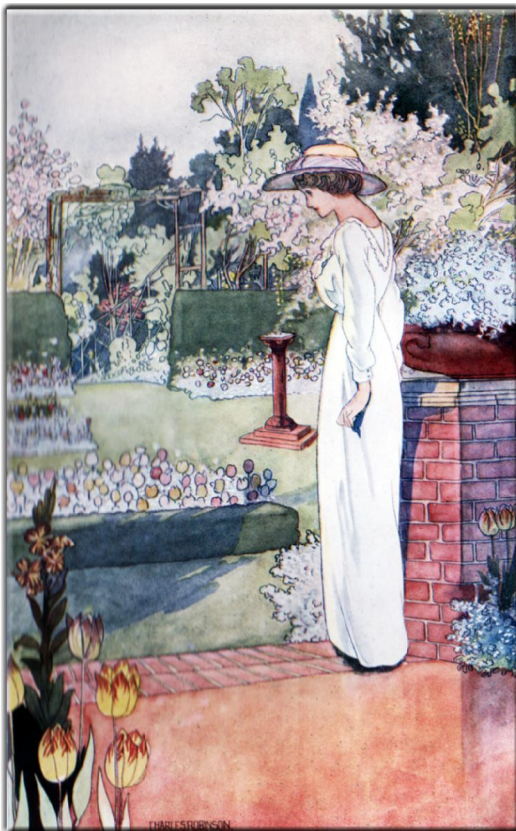
Seite 16: "Our sentimental Garden": Illustrator: Charles Robinson, Autoren: Agnes & Egerton Castle, Verlag: William Heinemann, (London 1912)