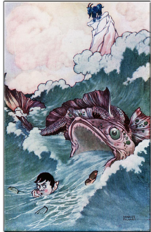
"Pinocchio, The Tale of a Puppet", London, (ca. 1925) Seite 156, Illustrator: M. A. Murray, Verlag: J. M. Dent & Sons

Liebe Freunde von Symbolon, die ersten drei Staffeln unserer Serie "Petites Images" (kleine Bilder) ist mit den Blättern 1.1 bis 1.20, 2.1 bis 2.20 und 3.1 bis 3.20 beendet. Und so beginnt ein neuer Zyklus. Mit den Nummern 4.1 bis 4.20 wird es wieder jeden Dienstag je 2 mal 4 Bilder geben. Mit neuen Illustratoren, die jeweils ziemlich unbekannt sind. Die endlich wieder – das ist unser Anspruch – aus dem Dunkel des Vergessens hinauf gehoben werden sollen. Ein Künstler freilich war schon mit 4 Bildern im 3. Zyklus anwesend. Er ist so gut, dass wir ihn auch in der 4. Staffel weiter lebendig lassen wollen. Wieder wird Ferdinand Heindl aus Wien die Bilder für das Netz bearbeiten. Dafür gilt ihm – wie immer – unser Dank! Bis heute sind 60 Blätter mit 240 Illustrationen in unserem kleinen (petit) Bauchladen erschienen. Jetzt also auf zu den nächsten 80 Bildern!