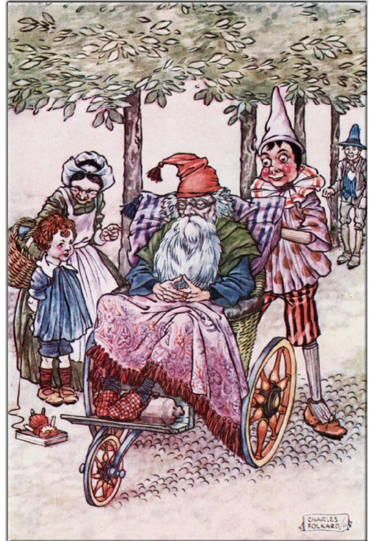
"Pinocchio, The Tale of a Puppet", London, (ca. 1925) Seite 162, Illustrator: M. A. Murray, Verlag: J. M. Dent & Sons

die ersten drei Staffeln unserer Serie "Petites Images" (kleine Bilder) ist mit den Blättern 1.1 bis 1.20, 2.1 bis 2.20 und 3.1 bis 3.20 beendet. Und so beginnt ein neuer Zyklus. Mit den Nummern 4.1 bis 4.20 wird es wieder jeden Dienstag je 2 mal 4 Bilder geben. Mit neuen Illustratoren, die jeweils ziemlich unbekannt sind. Die endlich wieder – das ist unser Anspruch – aus dem Dunkel des Vergessens hinauf gehoben werden sollen. Ein Künstler freilich war schon mit 4 Bildern im 3. Zyklus anwesend. Er ist so gut, dass wir ihn auch in der 4. Staffel weiter lebendig lassen wollen. Wieder wird Ferdinand Heindl aus Wien die Bilder für das Netz bearbeiten. Dafür gilt ihm – wie immer – unser Dank! Bis heute sind 60 Blätter mit 240 Illustrationen in unserem kleinen (petit) Bauchladen erschienen. Jetzt also auf zu den nächsten 80 Bildern!