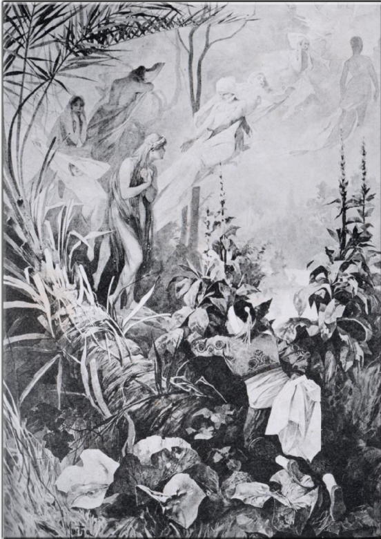
Ein sehr unbekannter "Alfons MUCHA": Illustrationen des Buches: Xavier Marmier, Contes D' Meres, Paris 1892, Seite 23