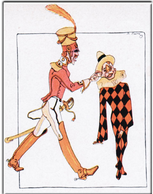
"Kasperle" Ein Schelmenbuch von Egon Hugo Strasburger, Illustrationen von Rolf Tielke, Verlegt: Globus Verlag, Berlin (ca. 1928), Seite 4