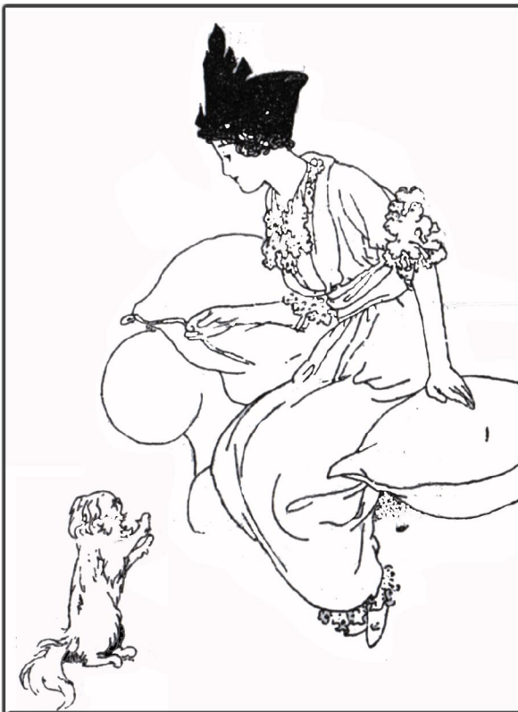
Seite 133: "Our sentimental Garden": Illustrator: Charles Robinson. Autoren: Agnes & Egerton Castle, Verlag: William Heinemann, (London 1912)