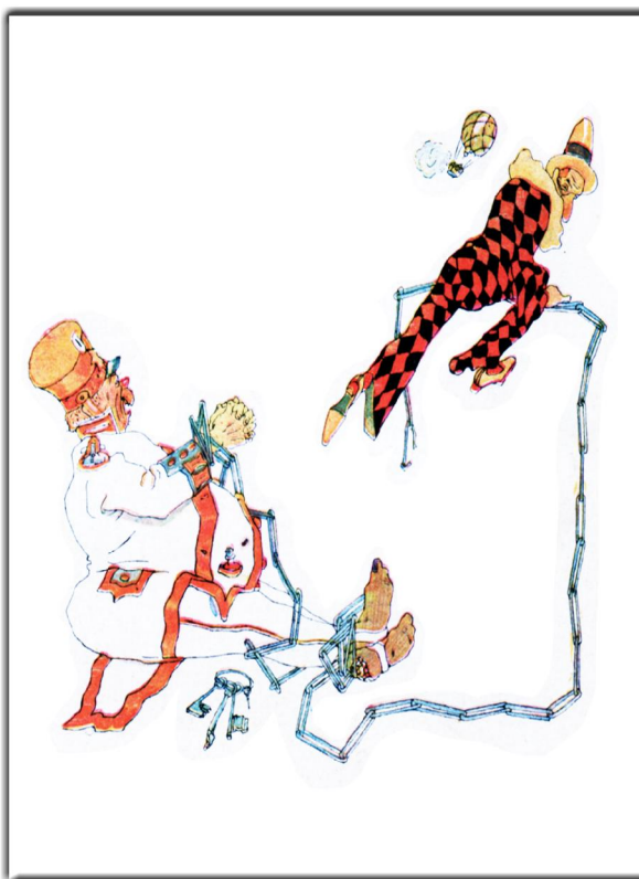
"Kasperle" Ein Schelmenbuch von Egon Hugo Strasburger, Illustrationen von Rolf Tielke, Verlegt: Globus Verlag, Berlin (ca. 1928), (auch) Seite 4