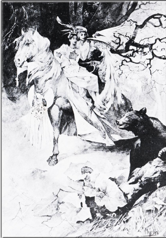
Ein sehr unbekannter "Alfons MUCHA": Illustrationen des Buches: Xavier Marmier, Contes D' Meres, Paris 1892, Seite 41

Liebe Freunde von Symbolon, die ersten drei Staffeln unserer Serie "Petites Images" (kleine Bilder) ist mit den Blättern 1.1 bis 1.20, 2.1 bis 2.20 und 3.1 bis 3.20 beendet. Und so beginnt ein neuer Zyklus. Mit den Nummern 4.1 bis 4.20 wird es wieder jeden Dienstag je 2 mal 4 Bilder geben. Mit neuen Illustratoren, die jeweils ziemlich unbekannt sind. Die endlich wieder – das ist unser Anspruch – aus dem Dunkel des Vergessens hinauf gehoben werden sollen. Ein Künstler freilich war schon mit 4 Bildern im 3. Zyklus anwesend. Er ist so gut, dass wir ihn auch in der 4. Staffel weiter lebendig lassen wollen. Wieder wird Ferdinand Heindl aus Wien die Bilder für das Netz bearbeiten. Dafür gilt ihm – wie immer – unser Dank! Bis heute sind 60 Blätter mit 240 Illustrationen in unserem kleinen (petit) Bauchladen erschienen. Jetzt also auf zu den nächsten 80 Bildern!