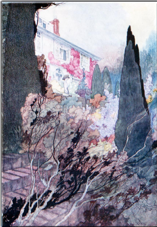
Seite 234: "Our sentimental Garden": Illustrator: Charles Robinson. Autoren: Agnes & Egerton Castle, Verlag: William Heinemann, (London 1912)