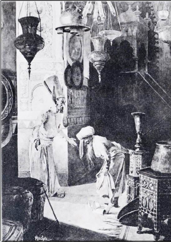
Ein sehr unbekannter "Alfons MUCHA": Illustrationen des Buches: Xavier Marmier, Contes D'Meres, Paris 1892, Seite 65