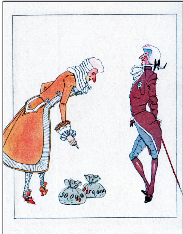
"Kasperle" Ein Schelmenbuch von Egon Hugo Strasburger, Illustrationen von Rolf Tielke, Verlegt: Globus Verlag, Berlin (ca. 1928), Seite 9