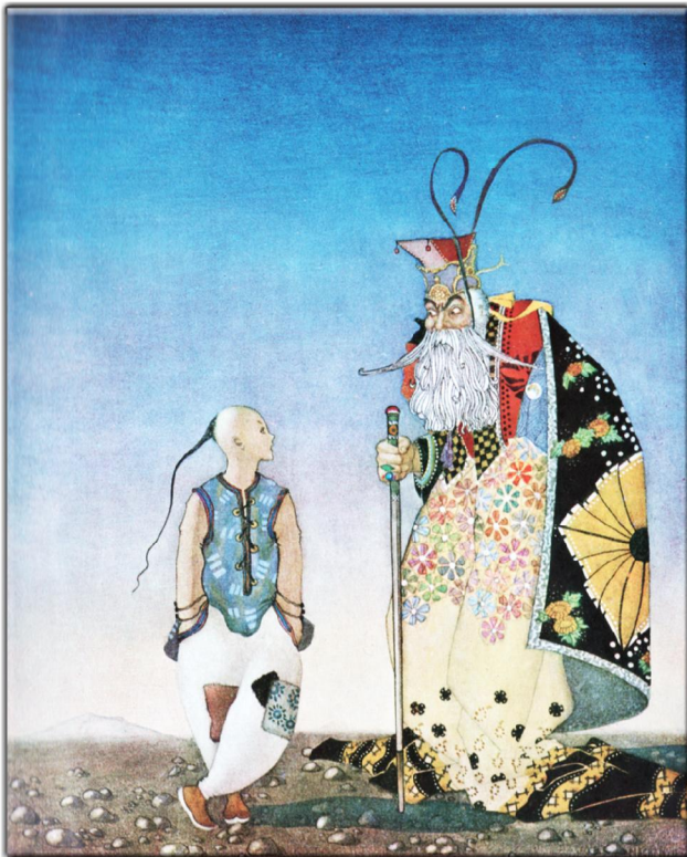
"Aladdin and his wonderful lamp": (1001 Nacht) Illustrator: Arthur Ransome Mackenzie: London & Nisbet & Co (London 1919), Seite 17