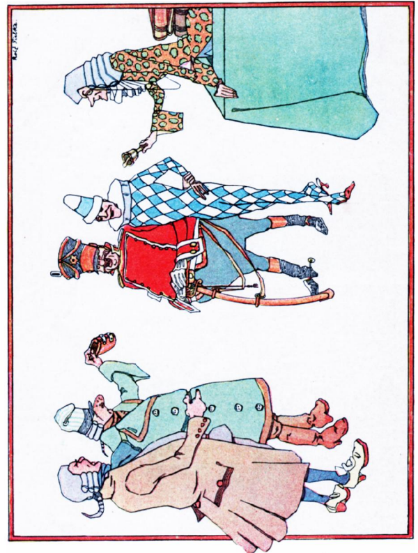
"Kasperle" Ein Schelmenbuch von Egon Hugo Strasburger, Illustrationen von Rolf Tielke, Verlegt: Globus Verlag, Berlin (ca. 1928), Seite 11