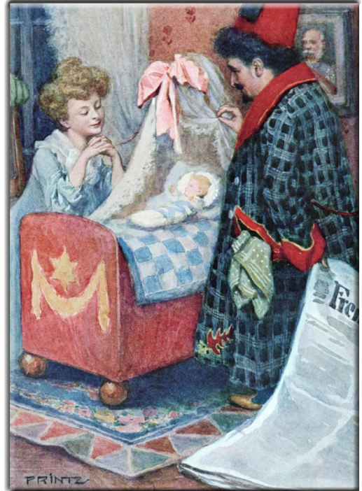
T. G. Starnfeld: Ein lustiges Wiener Märchen: “PICKERL”. Illustriert von Hans Printz, Verlag Gerlach & Wieling, Wien, ca. 1926 Geschichte von einem sehr kleinen Bübchen. Seite 17

Liebe Freunde von Symbolon, die ersten vier Staffeln unserer Serie “Petites Images” (kleine Bilder) ist mit den Blättern 1.1 bis 1.20, 2.1 bis 2.20, 3.1 bis 3.20 und 4.1 bis 4.20 beendet. Jetzt beginnt ein neuer Zyklus. Als 5.1 bis 5.20 wird es wieder jeden Dienstag je 2 mal 4 Bilder geben. Mit neuen Illustratoren, die jeweils ziemlich unbekannt sind. Die endlich wieder – das ist unser Anspruch – aus dem Dunkel des Vergessens hinauf gehoben werden sollen. Drei Künstler waren freilich schon im 4. Zyklus anwesend. Sie sind so gut, dass wir sie auch in der 5. Staffel weiter lebendig lassen wollen. Wieder wird Ferdinand Heindl aus Wien die Bilder für das Netz bearbeiten. Dafür gilt ihm – wie immer – unser grosser Dank! Bis heute sind 80 Blätter mit 320 Illustrationen in unserem kleinen (petit) Bauchladen erschienen. Jetzt also auf zu den nächsten 80 Bildern!