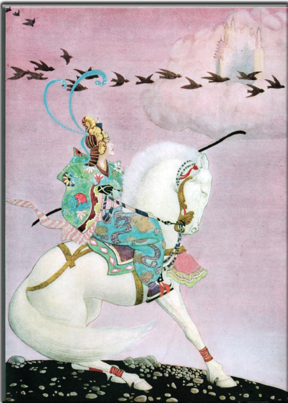
“Aladdin and his wonderful lamp”: (1001 Nacht) Illustrator: Arthur Ransome Mackenzie: London & Nisbet & Co (London 1919), Seite 35