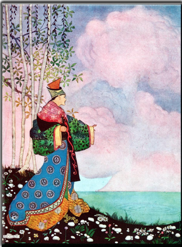
"Aladdin and his wonderful lamp": (1001 Nacht) Illustrator: Arthur Ransome Mackenzie: London & Nisbet & Co (London 1919), Seite 39