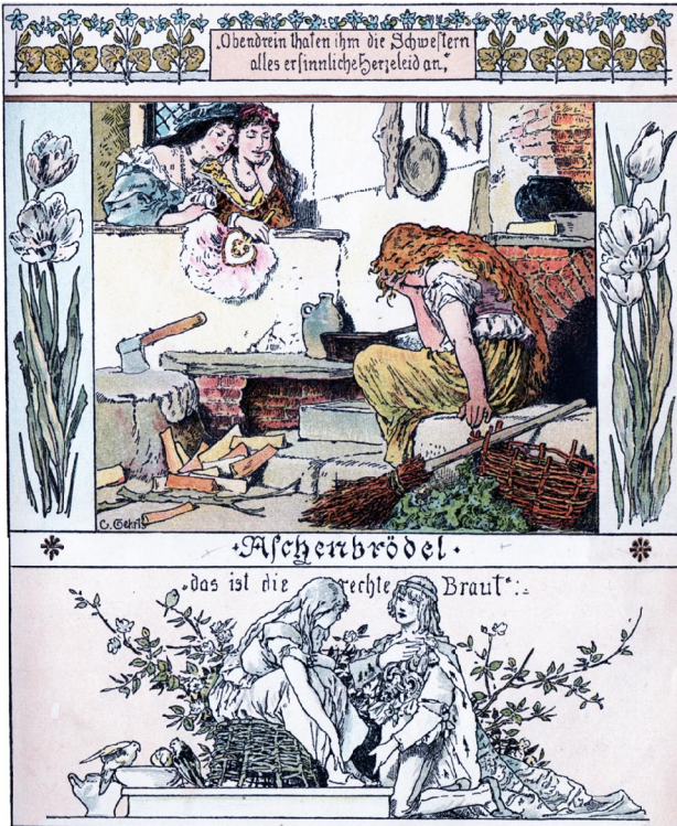
„Das Goldene Märchenbuch“: Herausgeber: Chr. Dieffenbach, Illustrationen von Carl Gehrts, Aschenbrödel, Verlag M. Heinsius, Bremen, 1892, ca. 1896, Seite 16