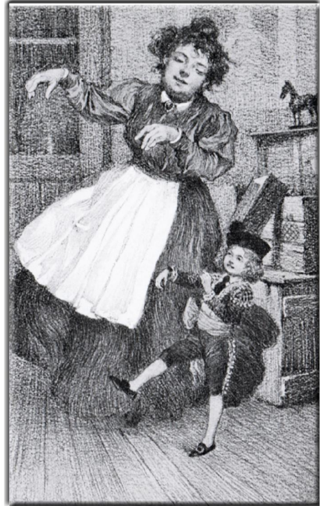
T. G. Starnfeld: Ein lustiges Wiener Märchen: "PICKERL". Illustriert von Hans Prinz, Verlag Gerlach & Wieling, Wien, ca. 1926 Pickerl tanzt zu zweit, Seite 29

die ersten vier Staffeln unserer Serie "Petites Images" (kleine Bilder) ist mit den Blättern 1.1 bis 1.20, 2.1 bis 2.20, 3.1 bis 3.20 und 4.1 bis 4.20 beendet. Jetzt beginnt ein neuer Zyklus. Als 5.1 bis 5.20 wird es wieder jeden Dienstag je 2 mal 4 Bilder geben. Mit neuen Illustratoren, die jeweils ziemlich unbekannt sind. Die endlich wieder – das ist unser Anspruch – aus dem Dunkel des Vergessens hinauf gehoben werden sollen. Drei Künstler waren freilich schon im 4. Zyklus anwesend. Sie sind so gut, dass wir sie auch in der 5. Staffel weiter lebendig lassen wollen. Wieder wird Ferdinand Heindl aus Wien die Bilder für das Netz bearbeiten. Dafür gilt ihm – wie immer – unser grosser Dank! Bis heute sind 80 Blätter mit 320 Illustrationen in unserem kleinen (petit) Bauchladen erschienen. Jetzt also auf zu den nächsten 80 Bildern!