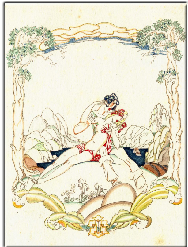
“Daphnis & Chloe” 1657 aus dem Griechischen Übersetzt von, George Thornley, Illustrationen von John Austen, Verlegt: 1925, Verlag, Geoffrey Bles, Bild 2