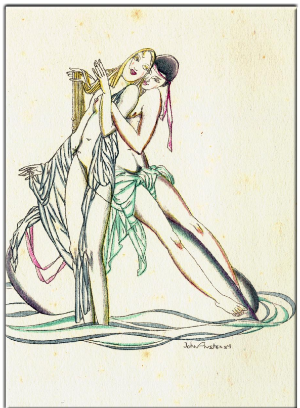
“Daphnis & Chloe” 1657 aus dem Griechischen Übersetzt von, George Thornley, Illustrationen von John Austen, Verlegt: 1925, Verlag, Geoffrey Bles, Bild 3