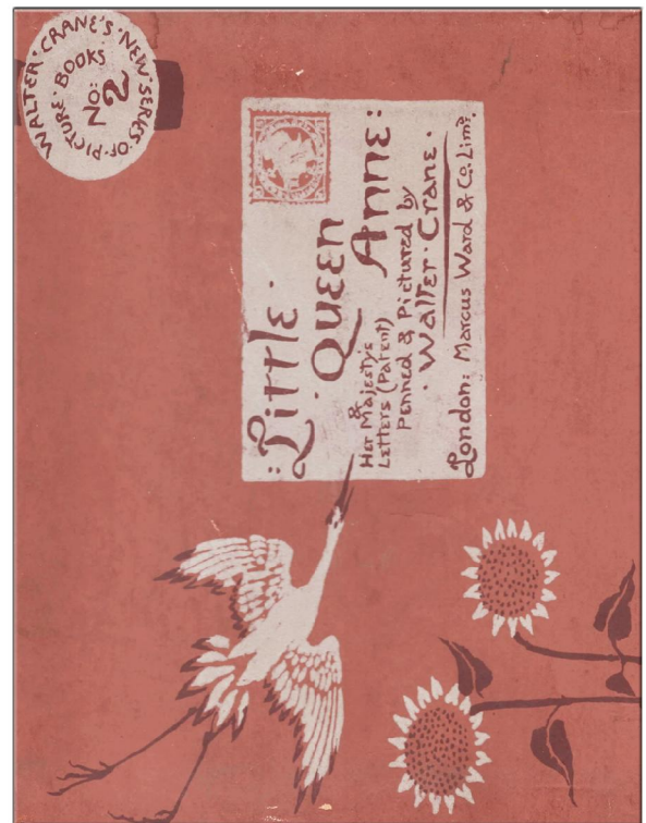
“Little Queen Anne” 1886 London Verlag , Marcus Ward & Co Limd, Illustrationen von Walter Crane, Umschlagseite