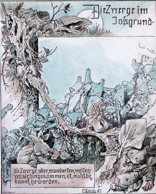
“Das Goldene Märchenbuch”: Herausgeber: Chr. Dieffenbach, Illustrationen von Carl Gehrts, Die Zwerge im Jofsgrund Verlag M. Heinsius, Bremen, 1892, ca. 1896, Seite 70