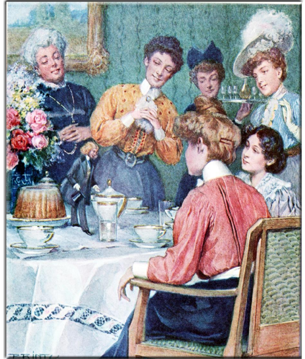
T. G. Starnfeld: Ein lustiges Wiener Märchen: "PICKERL". Illustriert von Hans Prinz, Verlag Gerlach & Wieling, Wien, ca. 1926 Pickerl auf dem Esstisch, Seite 94

die ersten vier Staffeln unserer Serie "Petites Images" (kleine Bilder) ist mit den Blättern 1.1 bis 1.20, 2.1 bis 2.20, 3.1 bis 3.20 und 4.1 bis 4.20 beendet. Der fünfte Zyklus von 5.1 bis 5.20 wird wieder an jeden Dienstag je 2 mal 4 Bilder aufweisen. (Er ist heute fertig). Mit neuen Illustratoren, die ziemlich unbekannt sind. Die endlich wieder – das ist unser Anspruch – aus dem Dunkel des Vergessens hinauf gehoben werden. Drei Künstler waren freilich schon im 4. Zyklus anwesend. Sie sind so gut, dass wir sie auch in der 5. Staffel weiter lebendig lassen wollen. Wieder wird Ferdinand Heindl aus Wien die Bilder für das Netz bearbeiten. Dafür gilt ihm – wie immer – unser grosser Dank! Bis heute sind 80 Blätter mit 320 Illustrationen in unserem kleinen (petit) Bauchladen erschienen. Jetzt also auf zu den nächsten 80 Bildern!