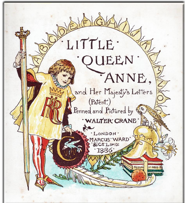
“Little Queen Anne” 1886 London Verlag, Marcus Ward & Co Lind, Illustrationen von Walter Crane, Erste Innenseite.