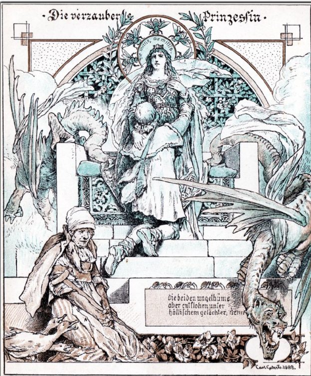
“Das Goldene Märchenbuch”: Herausgeber: Chr. Dieffenbach, Illustrationen von Carl Gehrts, Die verzauberte Prinzessin. Verlag M. Heinsius, Bremen, 1892, ca. 1896, Seite 100